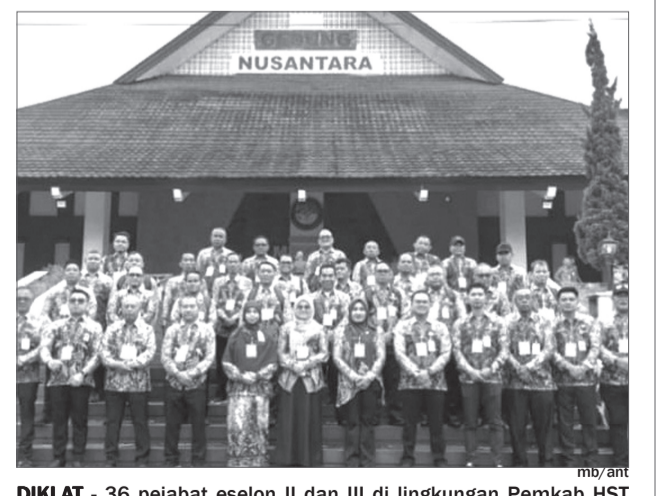
DIKLAT - 36 pejabat eselon II dan III di lingkungan Pemkab HST saat mengikuti diklat di IPDN Jatnanangor, Samedang, Jawa Barat.

BARABAI - Pemerintah Kabupaten Hulu Sungai Tengah (Pemkab HST), Kalimantan Selatan (Kalsel) mengutus 36 pejabat mengikuti pendidikan dan pelatihan (diklat) pengembangan kompetensi kepemimpinan pemerintah yang digelar di Lapangan Parade Abdi Praja IPDN Jatnanangor. "Kegiatan ini merupakan langkah konkret dalam membentuk aparatur yang profesional, berintegritas, dan mampu memberikan pelayanan terbaik kepada masyarakat," kata Wakil Bupati (Wabup) HST Gusti Rosyaldi Elmi di Jatnanangor. Diklat ini juga sebagai upaya meningkatkan kualitas sumber daya aparatur pemerintah daerah yang diikuti 26 pejabat eselon II dan 10 pejabat eselon III di lingkungan