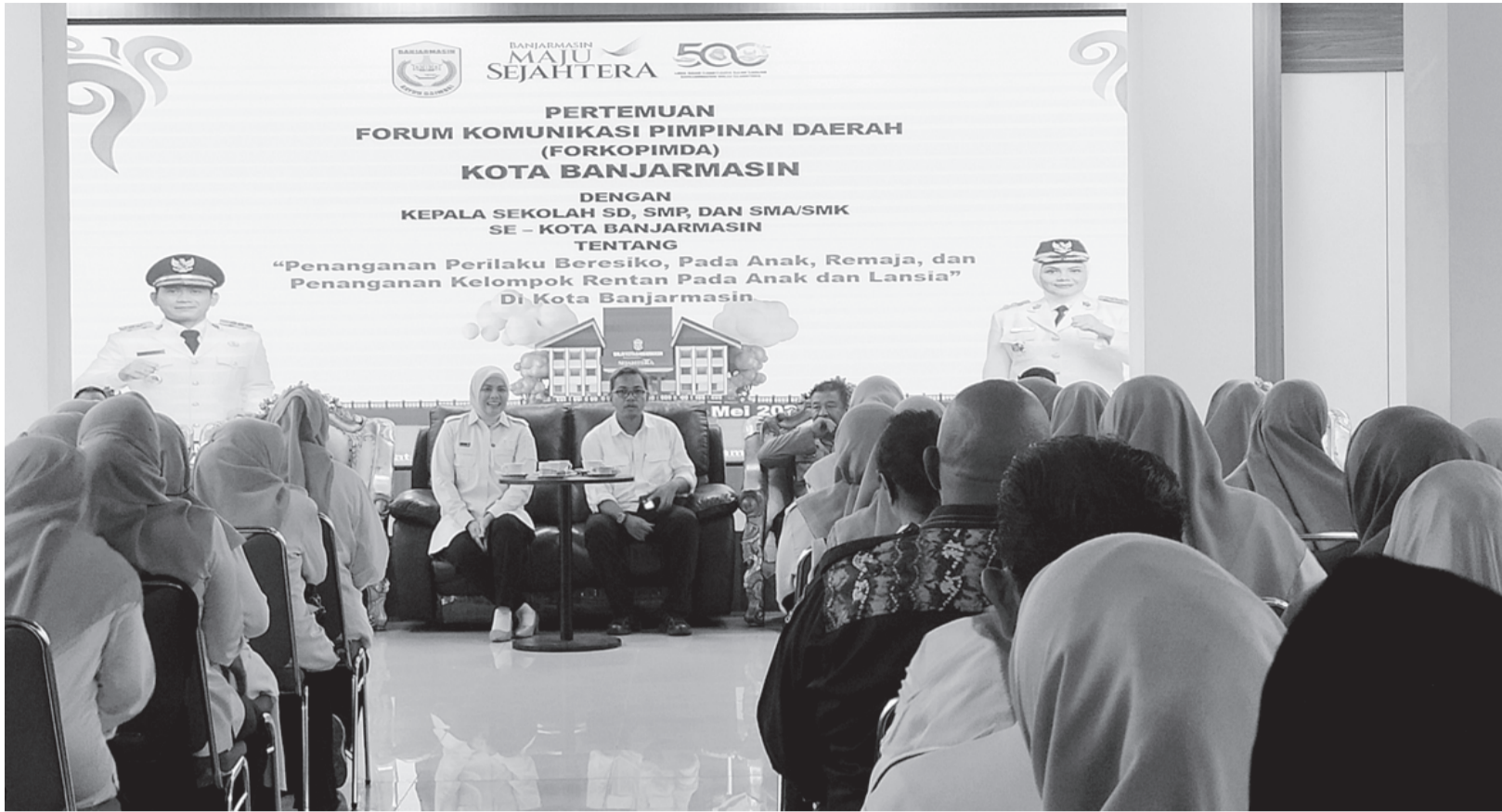
FORUM komunikasi pimpinan daerah (Forkopimda) Banjarmasin membahas pembinaan terhadap aksi negatif remaja di bawah umur.