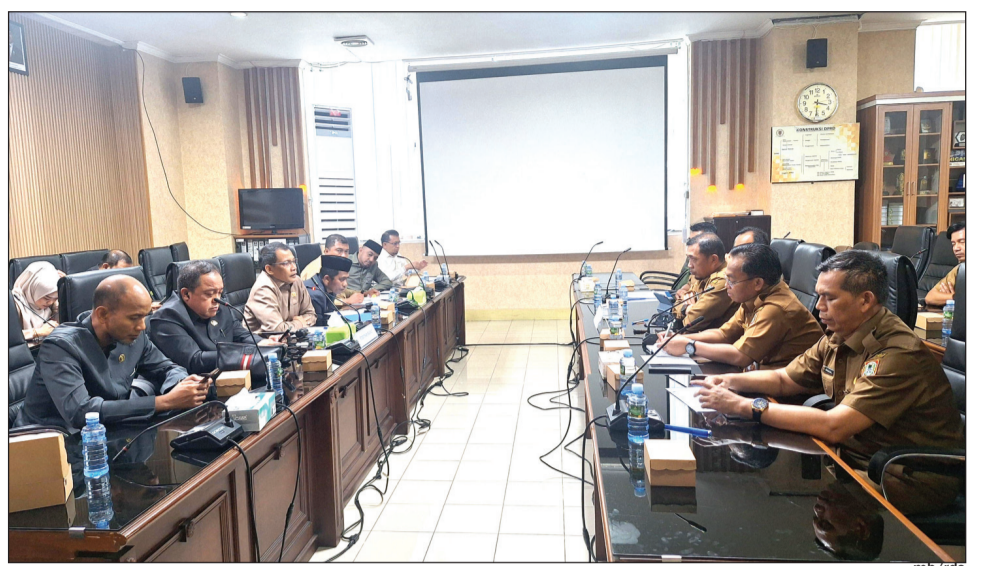
KOMISI III DPRD Provinsi Kalsel rapat dengan Dinas PUPR Provinsi Kalsel.

Ke depan, akan dilakukan koordinasi lanjutan melalui sekretariat rapat, khususnya terkait rencana pengelolaan oleh PT Bangun Banua.