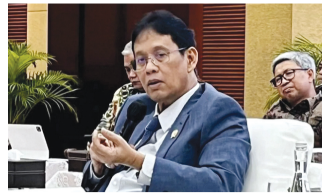
WAKIL Menteri Ketenagakerjaan (Wamenaker) Afriansyah Noor dalam acara Hyundai EV Ecosystem Tour di Cikarang, Bekasi.

Kolaborasi ini dinilai sebagai langkah strategis untuk meningkatkan kompetensi SDM sekaligus membuka peluang perluasan kesempatan kerja profesional di bidang otomotif bagi masyarakat. "Sinergi antara pemerintah, industri, dan lembaga pelatihan menjadi kunci agar Indonesia mampu menciptakan tenaga kerja yang produktif dan siap menghadapi tantangan masa depan di sektor green jobs," kata Wamenaker Ferry. an/ani