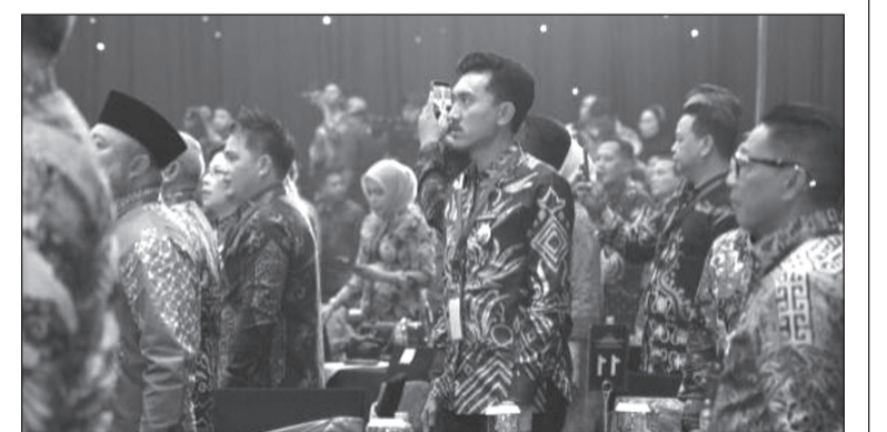
APRESIASI - Bupati Banjar H Saidi Mansyur saat menghadiri acara Apresiasi Pemerintah Daerah Berprestasi 2026 yang digelar Kementerian Dalam Negeri RI.

Untuk regional Kalimantan, ajang Apresiasi Kinerja Pemerintah Daerah Berprestasi 2026 dilaksanakan di Platinum Hotel & Convention Hall Balikpapan