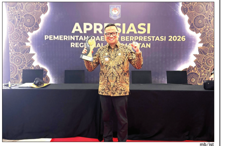
BUPATI Tabalong Saat Menerima Penghargaan Terbaik II Penurunan Pengangguran.

"Penghargaan ini kami persembahkan untuk seluruh masyarakat Tabalong. Mohon doa agar tahun depan dapat kita pertahankan bahkan kita tingkatkan," pungkasnya.