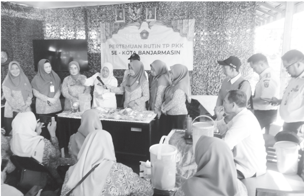
KETUA TP PKK dan kader PKK Banjarmasin sedang menyimak penjelasan tentang proses pengolahan sampah organik dan anorganik yang disampaikan agen 3 R.

BANJARMASIN - PKK Kota Banjarmasin mendorong pengurangan sampah plastik melalui kebiasaan belanja tanpa kantong sekali pakai. Program tersebut disosialisasikan dalam pertemuan rutin bulanan yang kali ini bertempat di Taman Edukasi dan Rekreasi Jahri Saleh, Rabu (6/5).