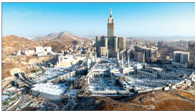
ILUSTRASI Masjidil Haram.