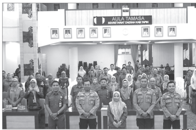
SOSIALISASI - Kegiatan sosialisasi asesmen center melalui PNBP yang di selenggarakan oleh BKPSDM Tapin.

RANTAU , - Menindaklanjuti surat dari Kepolisian Negara Republik Indonesia Daerah Kalimantan Selatan Resor Tapin nomor B/31/IV/KEP 2026 perihal Sosialisasi Assesment Center melalui PNBP Tahun 2026 dan penyerahan piagam penghargaan dari Kapolda Kalsel.