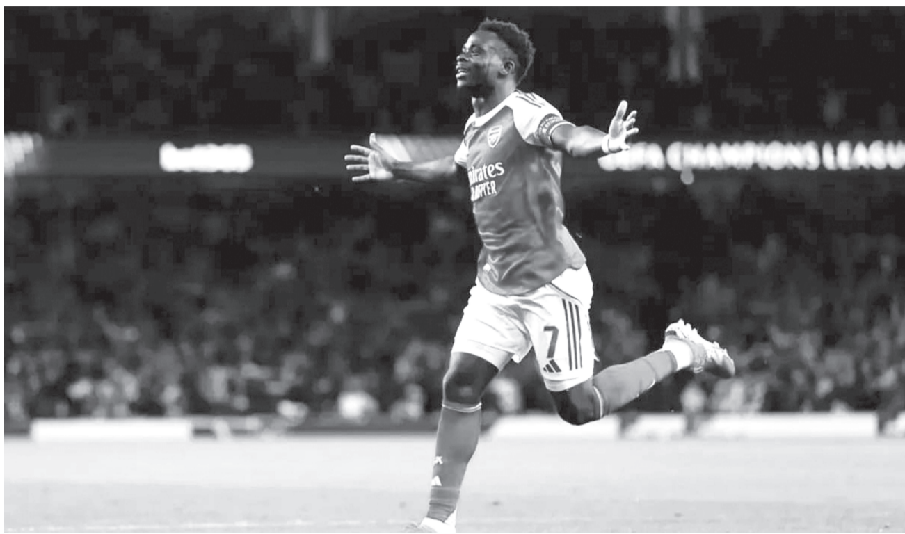
GOL PENENTU - Selebrasi Bukayo Saka setelah mencetak gol penentu kemenangan untuk Arsenal dalam pertandingan leg kedua semifinal Liga Champions 2025/26 di Emirates Stadium pada Selasa (5/5).