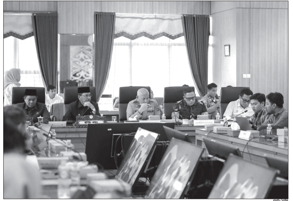
DPRD Provinsi Kalsel melaksanakan RDPU sekaligus menerima penyampaian aspirasi dari warga Sidomulyo serta gabungan mahasiswa yang tergabung dalam Aliansi BEM se-Kalsel.

Proses pengusulan Pegunungan Meratus sebagai Taman Nasional sendiri telah berjalan sejak 2020 dan masih dalam tahap pembahasan antara Pemerintah Provinsi Kalsel dan Kementerian Lingkungan Hidup dan