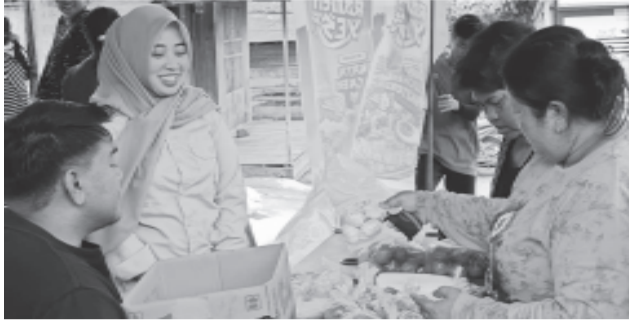
PASAR MURAH -Warga Desa Ajung sedang berbelanja di Pasar Murah Disperindag Balangan.

PARINGIN -Pemerintah Kabupaten Balangan melalui Dinas Perindustrian dan Perdagangan (Disperindag) menggelar pasar murah sebagai upaya menjaga stabilitas ekonomi masyarakat. Kali ini, kegiatan dilaksanakan di Desa Ajung, Kecamatan Tebing Tinggi, Selasa (5/5/2026). Pasar murah digelar bekerja sama dengan Dinas Ketahanan Pangan, Pertanian dan Perikanan Kabupaten Balangan serta