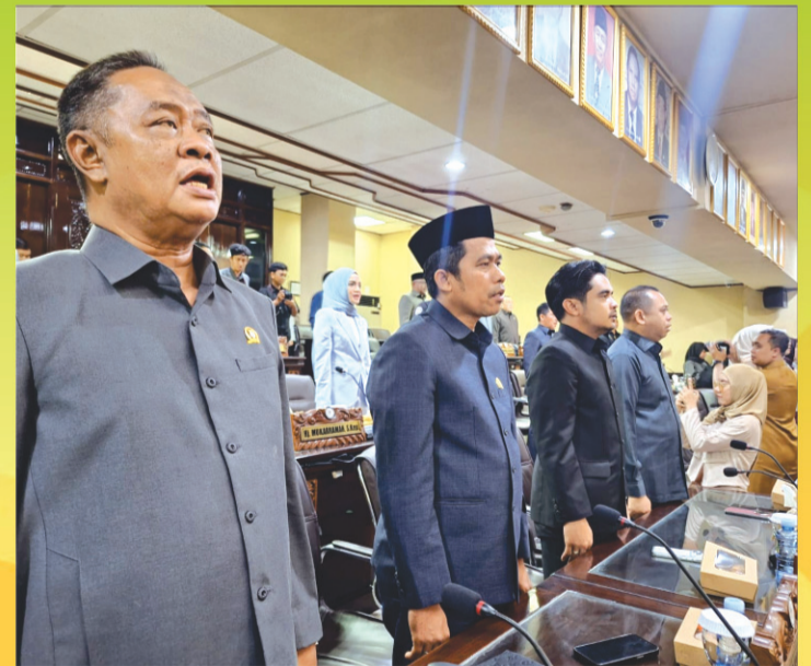
Anggota DPRD Kalsel hadir rapat paripurna penyampaian rekomendasi DPRD Provinsi Kalsel terhadap LKpj Gubernur Kalsel tahun 2025.