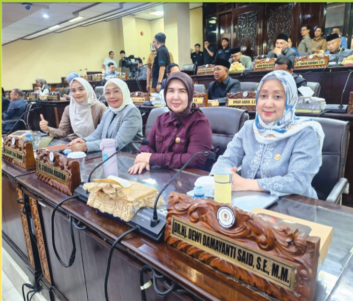
Anggota DPRD Provinsi Kalsel hadir rapat paripurna penyampaian rekomendasi DPRD Provinsi Kalsel terhadap LKpj Gubernur Kalsel tahun 2025