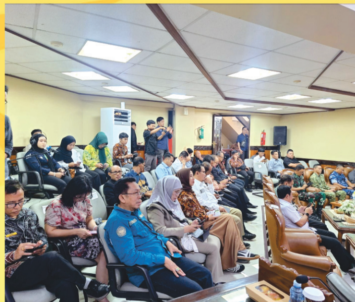
Tamu undangan menghadiri rapat paripurna penyampaian rekomendasi DPRD Provinsi Kalsel terhadap LKpj Gubernur Kalsel tahun 2025