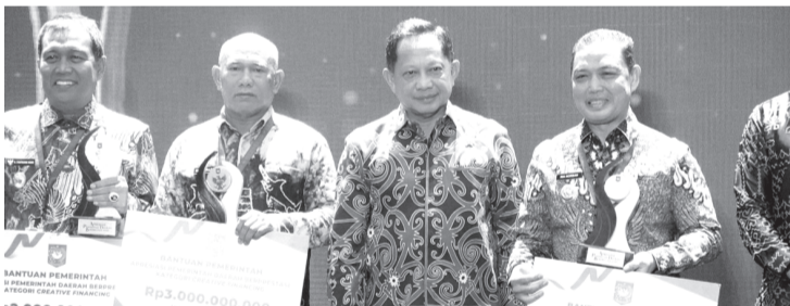
PENGHARGAAN -Bupati Kotabaru H.Muh. Rusli berfoto bersama usai menerima penghargaan yang diserahkan oleh wakil menteri dalam negeri Bima Arya Sugiarto yang di saksikan langsung Menteri Dalam Negeri Tito Karnavian, di Ballroom Hotel Platinum Balikpapan Kalimantan Timur.

KOTABARU - Pemerintah Kabupaten Kotabaru kembali menorehkan prestasi di tingkat nasional, dengan meraih Juara Pertama kategori Creative Financing dalam ajang Apresiasi Pemerintah Daerah Berprestasi tahun 2026 yang bersaing dengan 12 Kabupaten yang tergabung dalam Regional II Kalimantan. Penghargaan tersebut diterima langsung Bupati Kotabaru H.Muh. Rusli yang diserahkan oleh wakil dalam negeri Bima Arya Sugiarto yang di saksikan langsung Menteri Dalam Negeri Tito Karnavian dan Seluruh tamu undangan, Selasa Malam ( 5/5/2026) di Ballroom Hotel Platinum Balikpapan Kalimantan Timur. Ajang yang diselenggarakan Kementerian dalam negeri bekerjasama dengan Tempo ini menilai sejauh