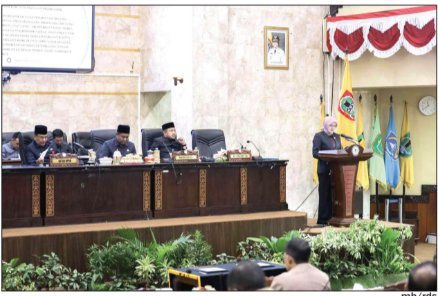
DPRD Provinsi Kalimantan Selatan (Kalsel) bersama Gubernur Kalsel menyepakati pembentukan Calon Daerah Otonom Baru (DOB) Kabupaten Tanah Kambang Lima dalam rapat paripurna.