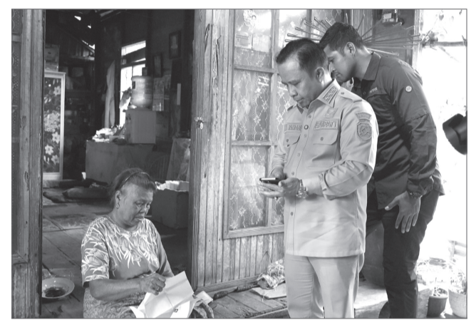
RUMAH - Bupati Tapin H Yamani saat meninjau rumah tidak layak huni dan memberikan bantuan bedah rumah.

kabupaten Tapin," paparnya. Dikatakan Bupati Tapin H Yamani, kepada Camat kiranya secepatnya mengumpulkan para kepala desa untuk mendata masyarakat yang tidak mampu dan mempunyai rumah tidak layak huni. Hal ini agar sesegera dapat kita berikan bantuan program bedah rumah. Ditambahkan H Yamani, beberapa program lainnya yakni memberikan jaminan kesehatan gratis bagi masyarakat Tapin ke Puskesmas dan rumah sakit daerah Datu Sanggul hanya dengan menunjukkan KTP. Mengupayakan peningkatan kesejahteraan pegawai (ASN dan Non ASN), guru - guru pesantren dan aparat desa (BPD dan anggota KAU, RT dan RW). Memberikan beasiswa bagi santri dan santriwati berprestasi untuk melanjutkan sekolah ke luar negeri (Hadramaut/Timur Tengah) serta beasiswa satu