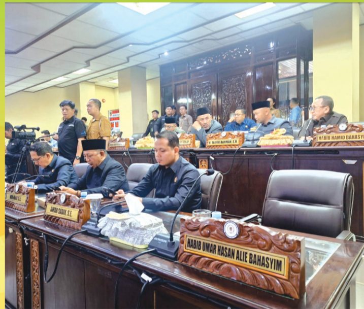
Anggota DPRD Provinsi Kalsel hadir rapat paripurna penyampaian rekomendasi DPRD Provinsi Kalsel terhadap LKpj Gubernur Kalsel tahun 2025