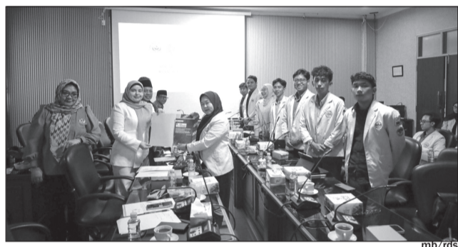
KOMISI IV DPRD Provinsi Kalimantan Selatan menerima audiensi dengan Badan Eksekutif Mahasiswa (BEM) Universitas Lambung Mangkurat (ULM) Tahun 2026.

"Mereka menyampaikan policy brief terkait masalah di bidang pendidikan dan juga