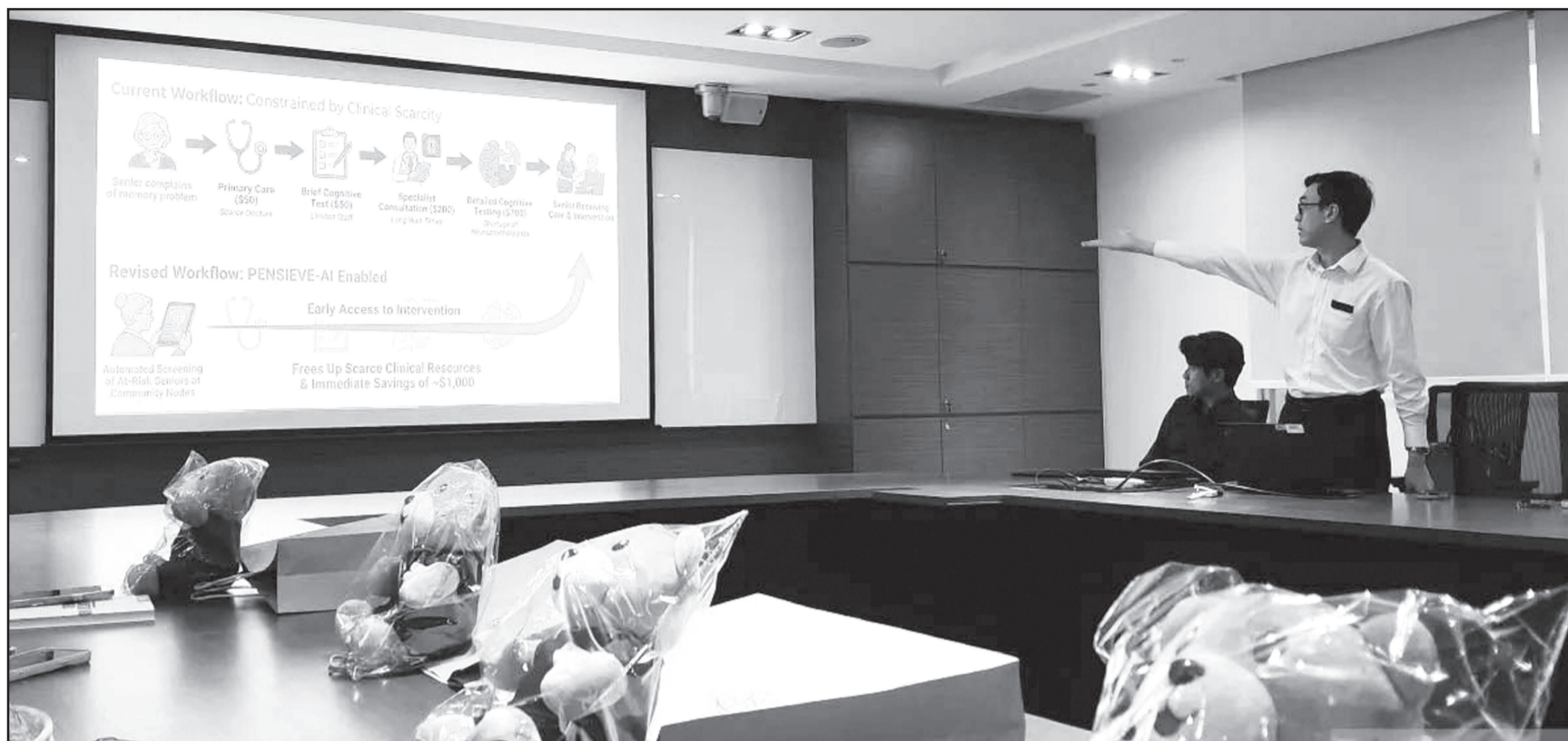
SINGAPORE General Hospital (SGH)

REDAKSI menerima sumbangan tulisan opini, artikel maupun surat pembaca lainnya. Panjang tulisan opini/artikel maksimal 3 (tiga) halaman kuarto, diketik dua spasi. Sedangkan surat pembaca maksimal 1 (satu) halaman kuarto. Semua isi tulisan opini dan artikel bukan mencerminkan sikap redaksi dan merupakan tanggung jawab penulisnya. Redaksi berhak mengedit tulisan sepanjang tidak mengubah esensi yang ada. Semua tulisan harus dilengkapi dengan identitas diri yang masih berlaku, dikirim Alamat Redaksi/Bisnis/Sirkulasi:Jl Pekapuran Raya Rt 32 No 87 Jl Lingkar Dalam Selatan Banjarmasin 70234