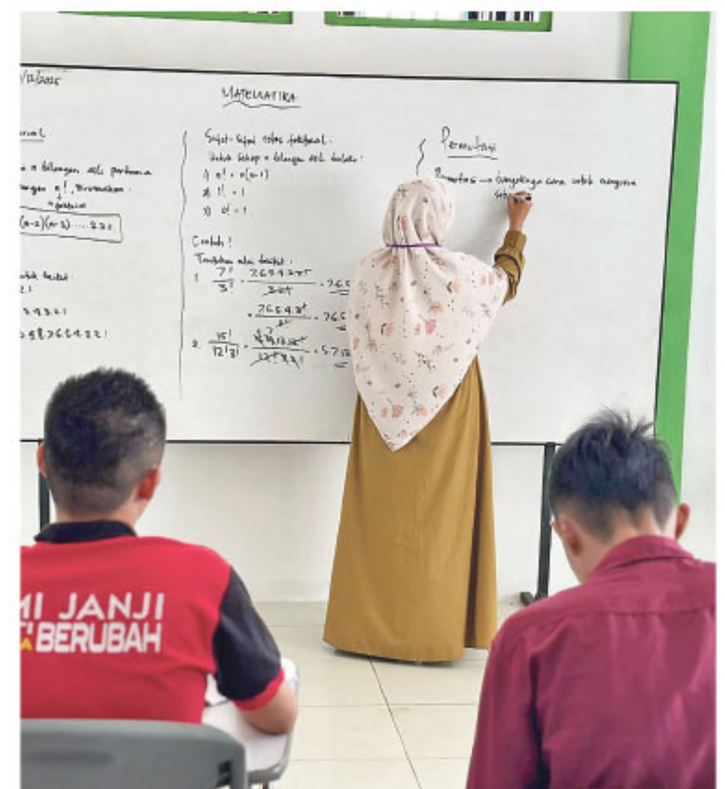
KEGIATAN PEMBELAJARAN - Sebanyak 51 warga binaan Lapas Nunukan mengikuti kegiatan pembelajaran Paket A, B, dan C di PKBM Lanuka, Selasa (5/5/2026). Program ini menjadi upaya pemenuhan hak pendidikan bagi WBP agar tetap dapat melanjutkan sekolah meski menjalani masa pidana.