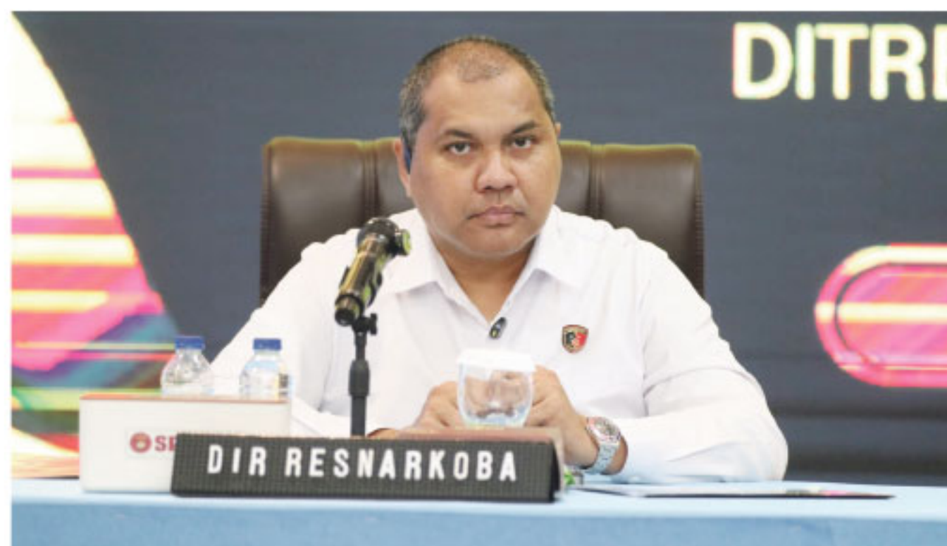
BERANTAS NARKOTIKA - Direktur Reserse Narkoba Polda Kaltim, Kombes Pol Romy Tamtelahitu, menyebut pengungkapan ini tidak berdiri sendiri, melainkan bagian dari kerja sama lintas instansi dalam memberantas peredaran narkotika di Kalimantan Timur.

Pengungkapan ini diharapkan dapat memberikan efek jera kepada pelaku sekaligus menciptakan situasi keamanan dan ketertiban masyarakat yang kondusif di Kalimantan Timur. (edo)