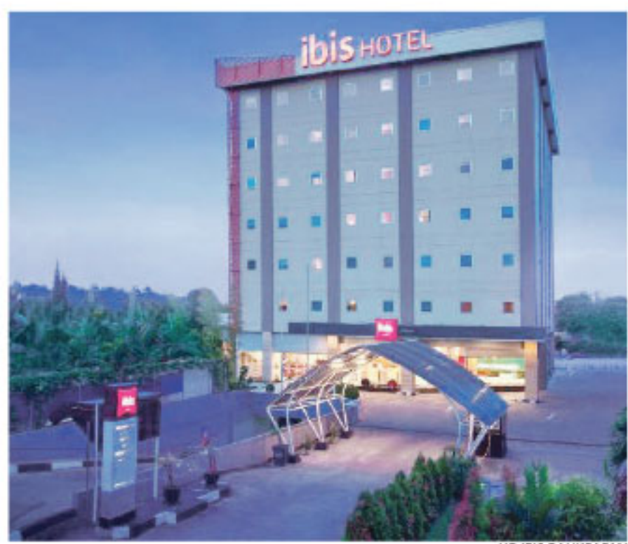
KONSEP SANTAI - Ibis Balikpapan menghadirkan konsep menginap yang lebih santai. Dengan tambahan fasilitas hiburan seperti biliar hingga angkringan. Konsep ini menjadi salah satu strategi untuk menarik minat tamu, khususnya kalangan muda.

lebih baik, karena curah hujan diperkirakan tetap terjadi meskipun dalam intensitas yang lebih rendah. "Semoga curah hujan tetap turun, sehingga kondisi kita tetap terkendali," pungkash Yudhi. (dha)