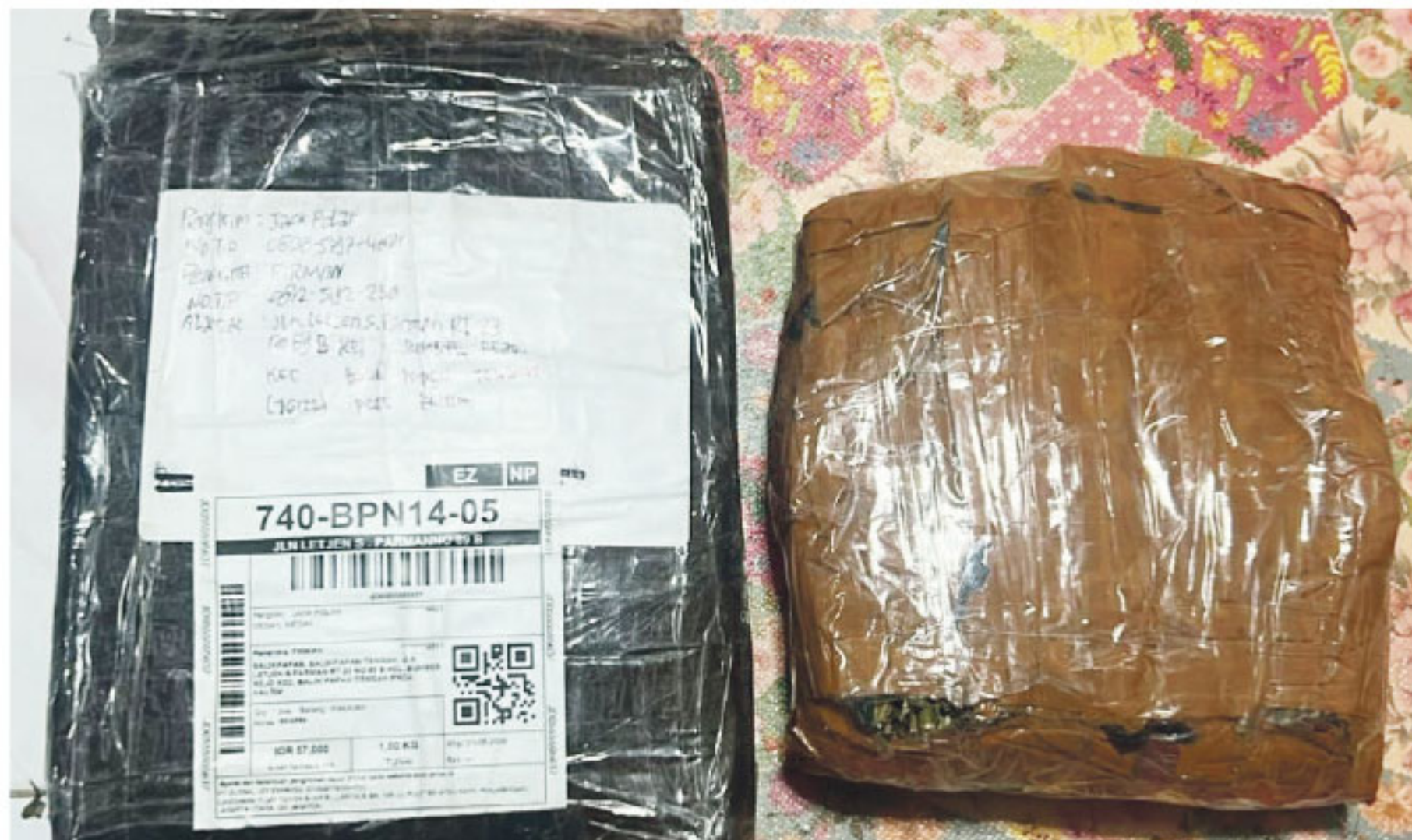
PEREDARAN NARKOTIKA - Direktorat Reserse Narkoba Polda Kalimantan Timur kembali mengungkap kasus peredaran narkotika di wilayah hukumnya. Seorang pria berinisial NF diamankan dengan barang bukti ganja seberat kurang lebih 1 kilogram, Selasa (5/5/2026) sekitar pukul 13.30 WITA.

Atas perbuatannya, tersangka dijerat Pasal 114 ayat (2) Undang-Undang Nomor 35 Tahun 2009 tentang Narkotika dengan ancaman hukuman berat. Polda Kaltim juga mengimbau masyarakat agar aktif melaporkan aktivitas mencurigakan terkait narkotika melalui layanan kepolisian 110 maupun kanal pengaduan resmi lainnya. Pengungkapan ini menjadi bagian dari komitmen aparat dalam menekan peredaran gelap narkotika serta menjaga situasi keamanan dan ketertiban masyarakat di Kalimantan Timur tetap kondusif. (edo)