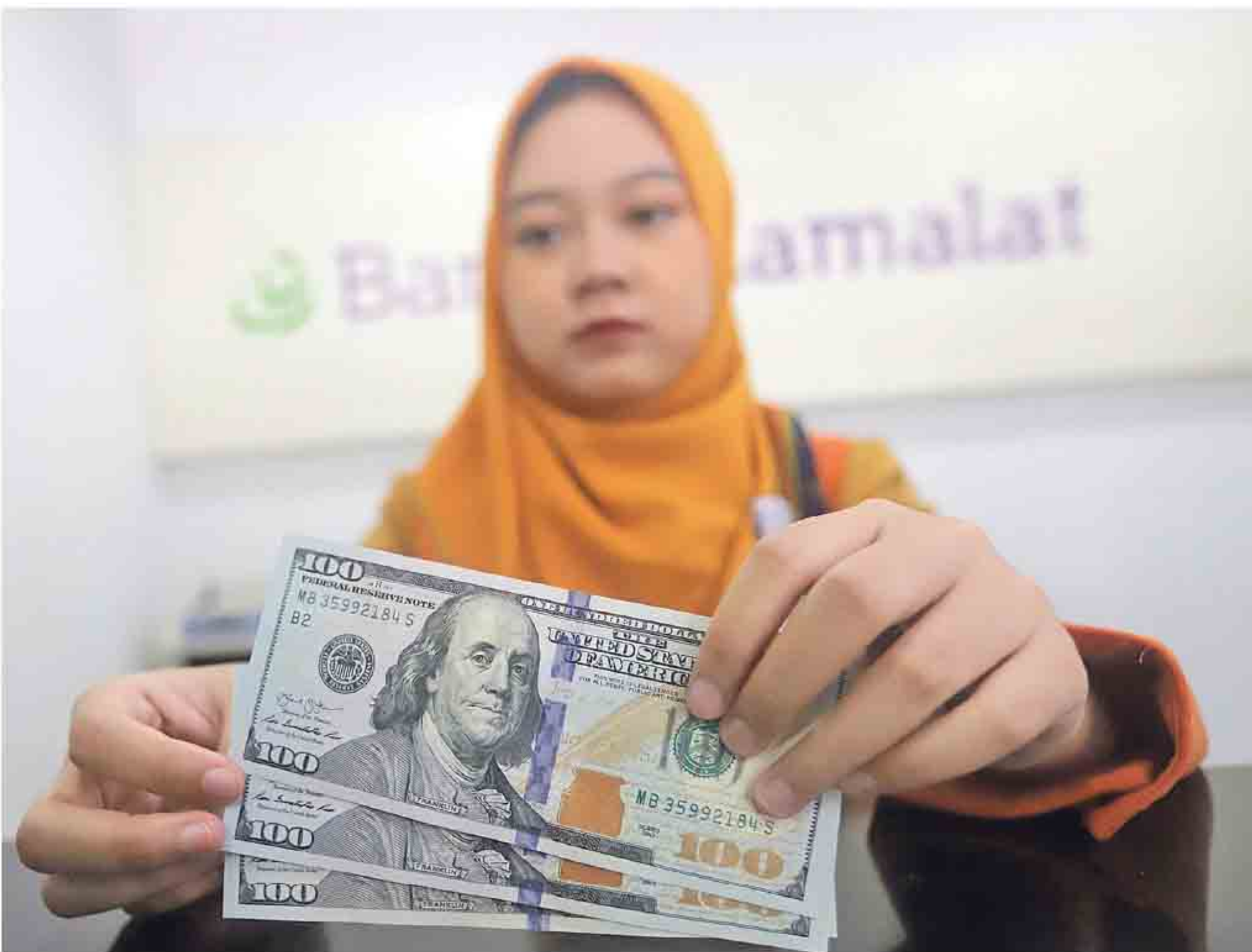
TUNJUKKAN UANG - Pegawai Bank menunjukkan uang dollar Amerika Serikat (AS) di kantor cabang Bank Muamalat Melawai, Jakarta Selatan.