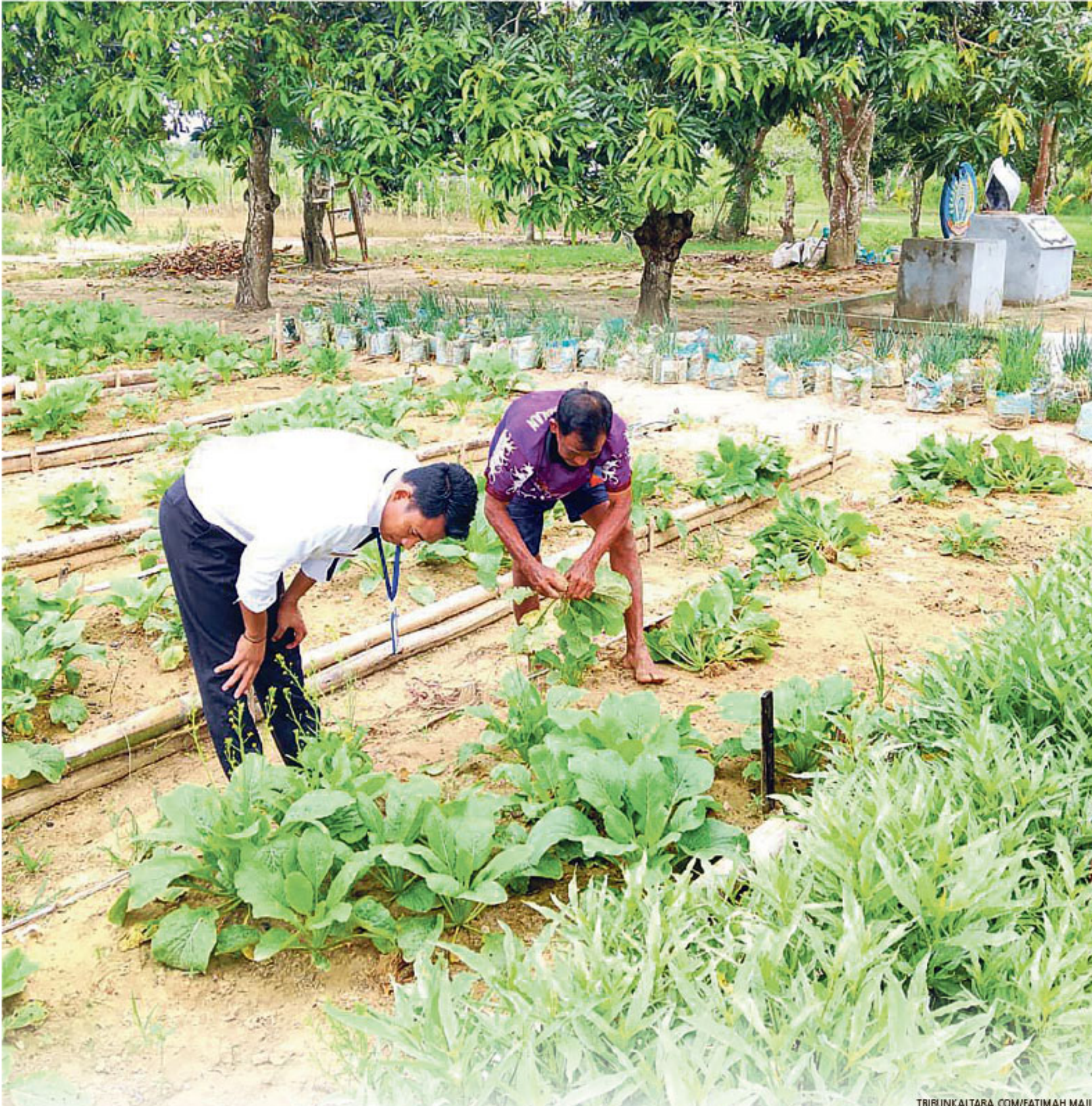
SAE LANUKA - Warga Binaan Pemasyarakatan (WBP) Lapas Nunukan melayani saat menjual hasil panen sayur mayur di Sarana Asimilasi dan Edukasi (SAE) Lanuka. Kegiatan ini menjadi bagian dari program pembinaan kemandirian sekaligus mendukung ketahanan pangan.