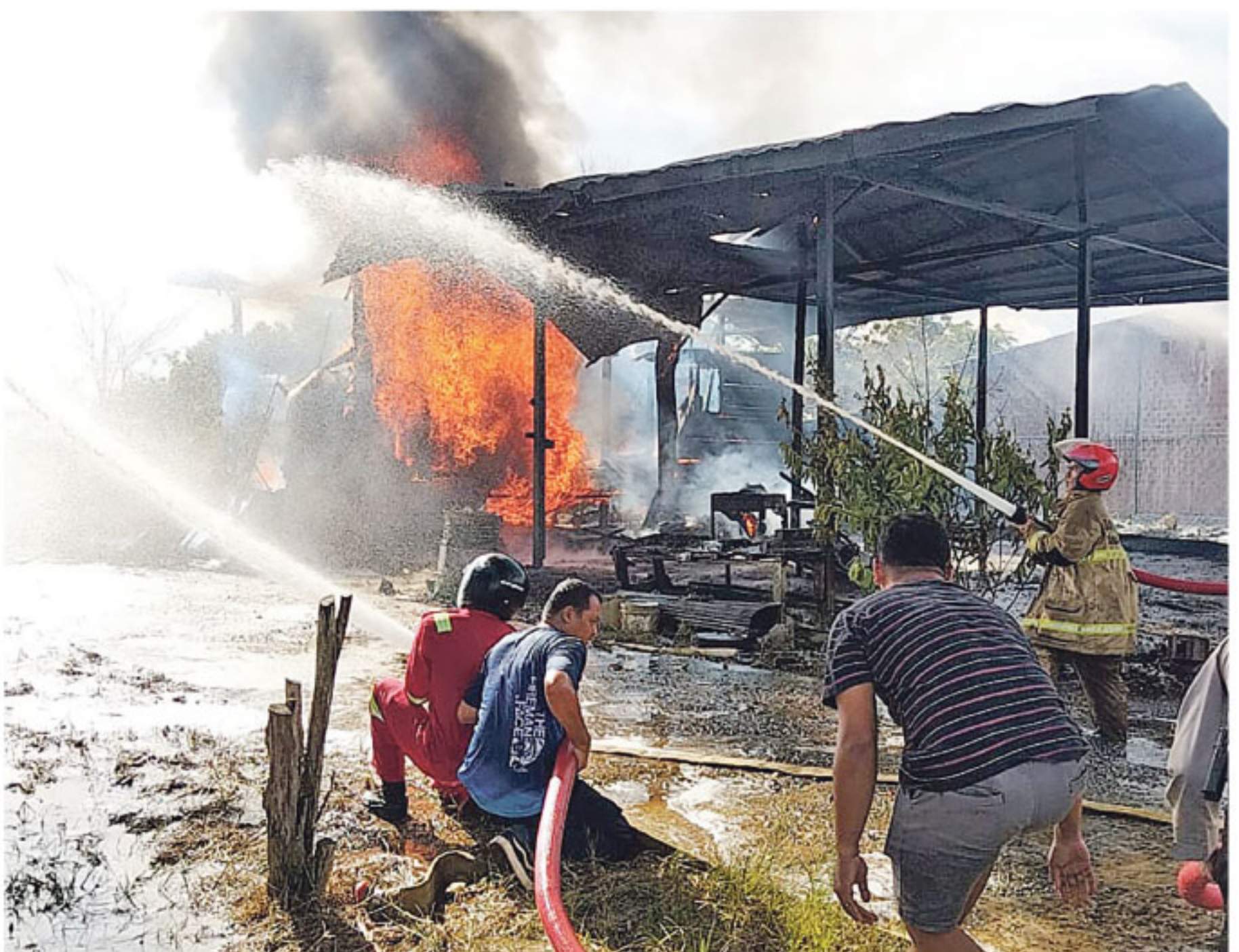
KEBAKARAN - Kebakaran yang terjadi di Jalan Trans Kaltara, Tideng Pale, Kecamatan Sesayap, Kabupaten Tana Tidung, Kaltara, gambar diambil Senin (29/12/2025). DPKP Tana Tidung akan lakukan inspeksi instalasi listrik di daerah pemukiman rawan kebakaran.

"Karena objek pajaknya bertambah, kami yakin penerimaannya bisa meningkat," pungkasnya. (des)