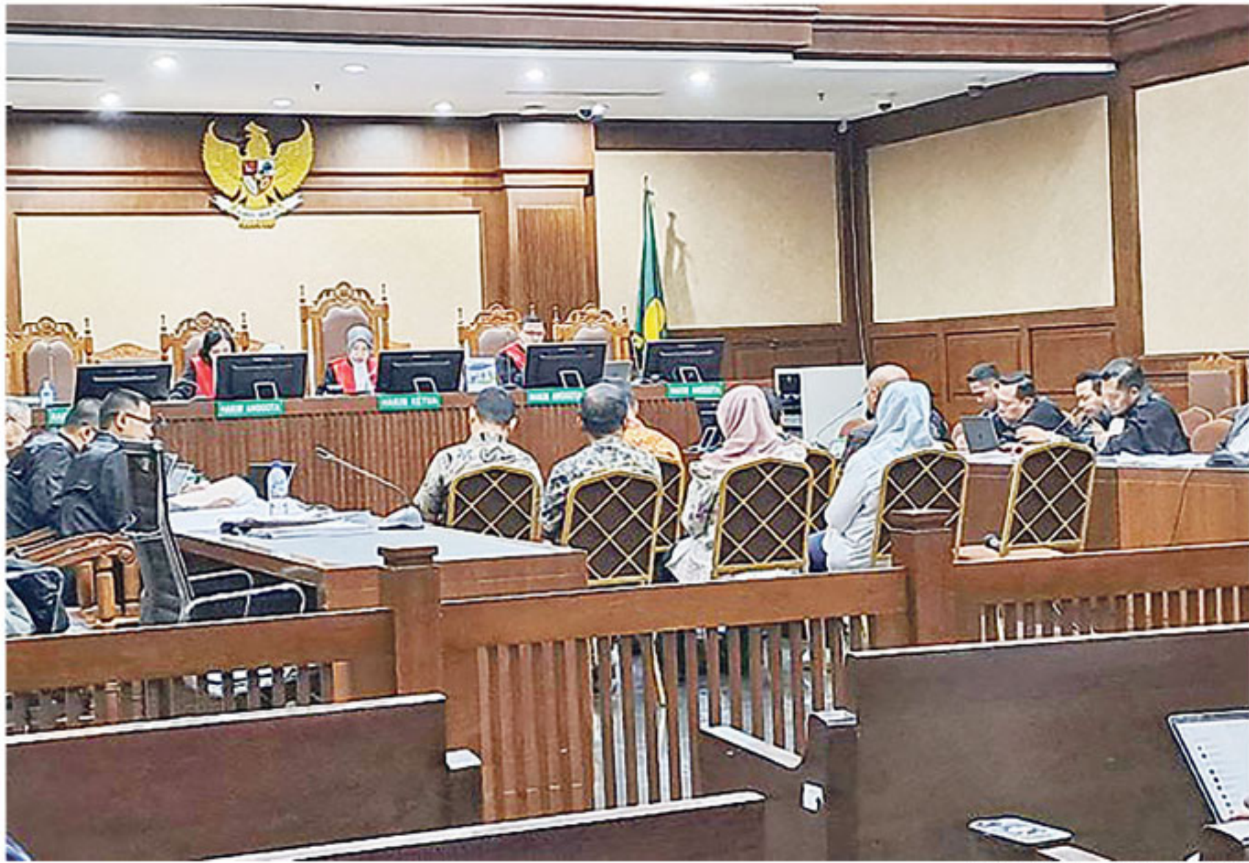
SIDANG - Persidangan dugaan pemerasan dalam pengurusan sertifikat Keselamatan dan Kesehatan Kerja (K3) di Kementerian Ketenagakerjaan kembali digelar pada Rabu (6/5).