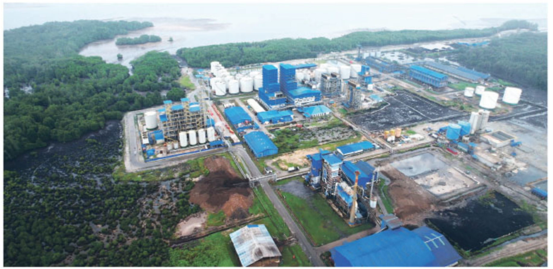
HO. DPMPTSP BONTANG