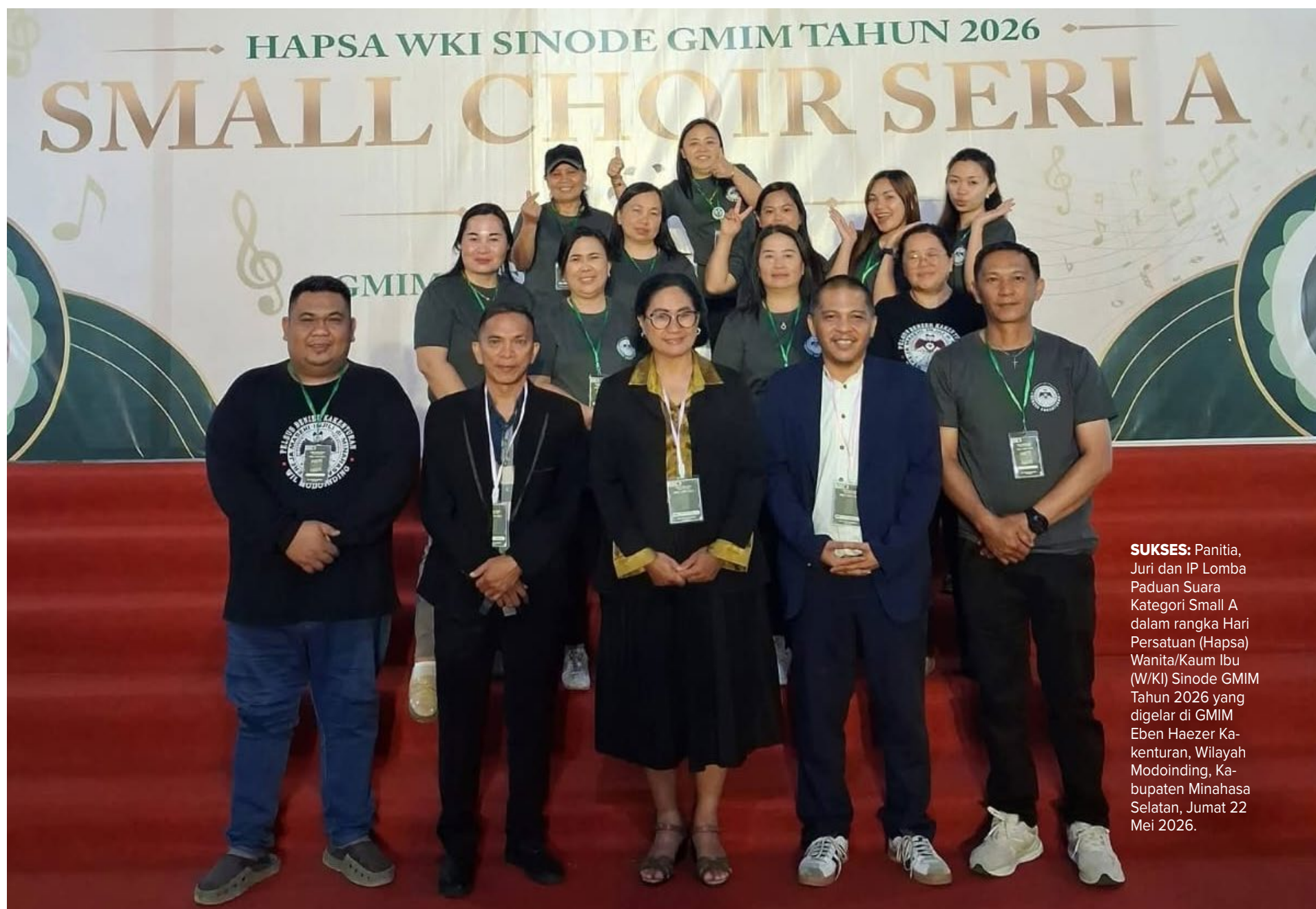
SUKSES: Panitia, Juri dan IP Lomba Paduan Suara Kategori Small A dalam rangka Hari Persatuan (Hapsa) Wanita/Kaum Ibu (W/KI) Sinode GMIM Tahun 2026 yang digelar di GMIM Eben Haezer Kakenturan, Wilayah Modinding, Kabupaten Minahasa Selatan, Jumat 22 Mei 2026.