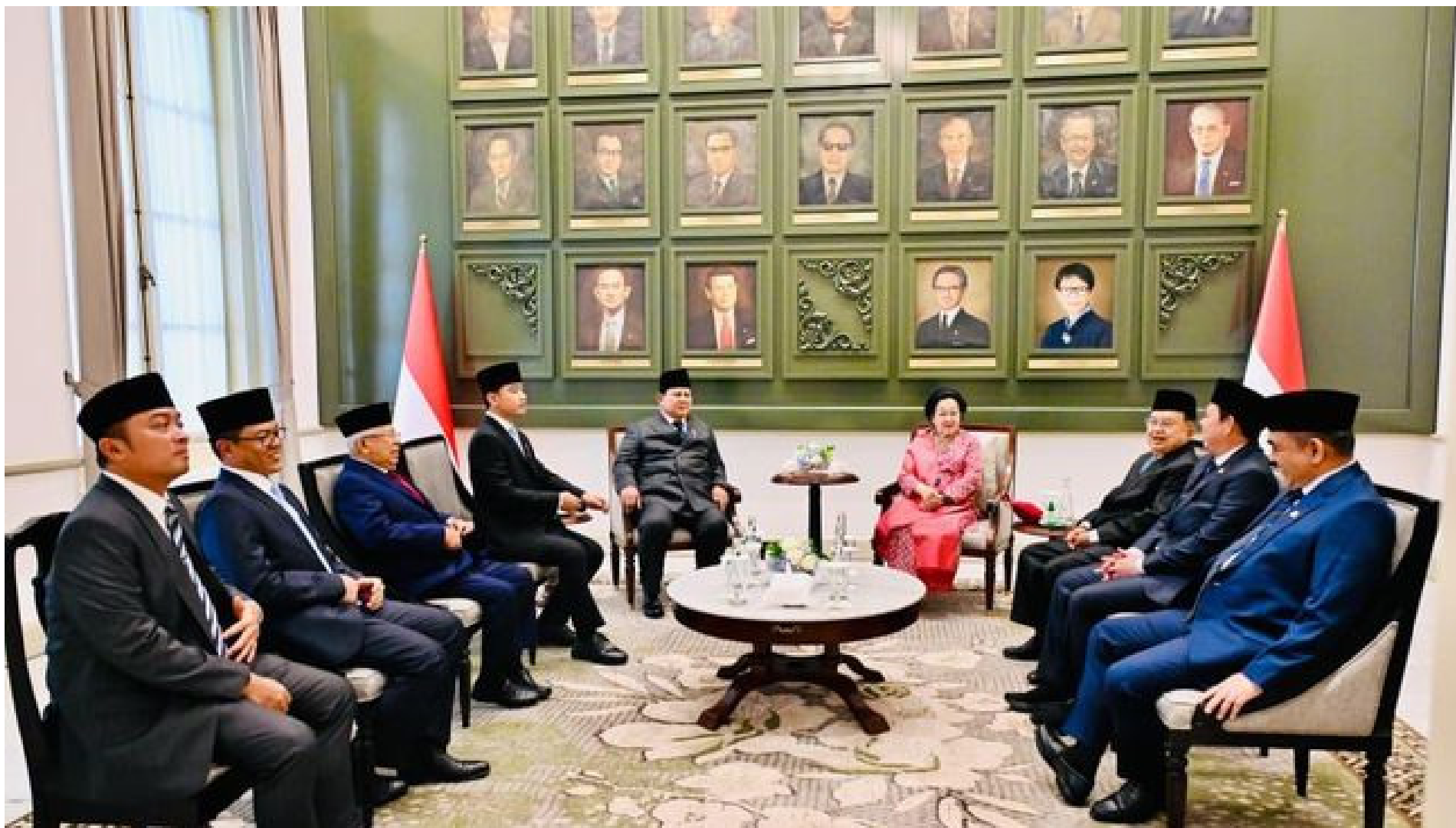
PRABOWO berbincang bareng Megawati hingga Gibran di Hari Lahir Pancasila, Senin (1/6/2026).

PRESIDEN Prabowo Subianto berbincang dengan sejumlah tokoh di sela peringatan Hari Lahir Pancasila. Dalam pertemuan itu, ada Wapres Gibran Rakabuming dan Ketua Dewan Pengarah BPPI sekaligus Presiden ke-5 Megawati Soekarnoputri. Apa yang dibahas?