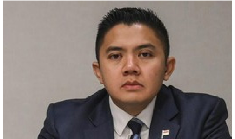
Teddy Indra Wijaya

SEKRETARIS Kabinet (Seskab) Teddy Indra Wijaya merespons kritikan dari eks Wakil Menteri Luar Negeri (Wamenlu) Dino Patti Djalal terkait frekuensi kunjungan kerja luar negeri Presiden Prabowo Subianto. Teddy meluruskan sejumlah hal sekaligus membeberkan sederet capaian konkret hasil diplomasi Prabowo.