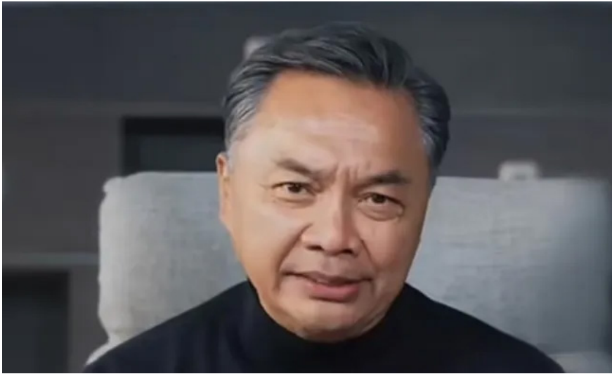
Dino Patti Djalal

JUGA BEBER CAPAIAN 1,5 TAHUN PRABOWO, RI MASUK BRICS-INVESTASI RP 2.430 T