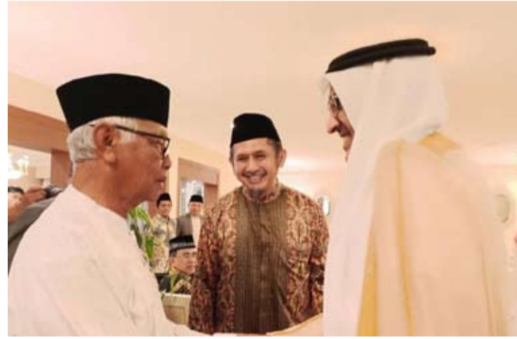
沙特阿拉伯驻印尼大使费萨尔·阿卜杜拉·阿莫迪(右)在其官邸迎接印尼伊斯兰教士理事会总主席KH·安瓦尔·伊斯坎达尔(左)的到访。

【本报讯】伊斯兰教士理事会(MUI)总主席KH·安瓦尔·伊斯坎达尔(Anwar-Iskandar)与沙特阿拉伯驻印尼大使费萨尔·阿卜杜拉·阿