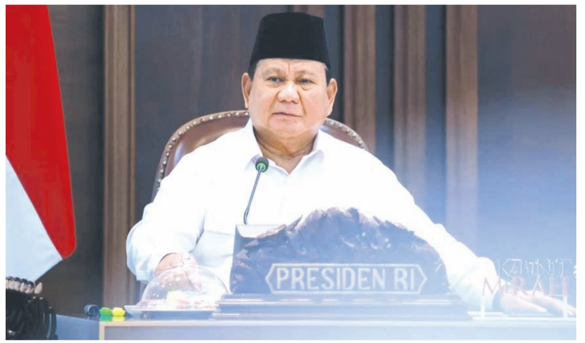
普拉博沃同时发布三项法规以提升国家粮食安全。

政府强调，这一基础设施加速和管理优化的进程需要全面的支持，包括加快审批、提供土地，以及解决现场的技术障碍，以便尽快实现粮食自给的目标。