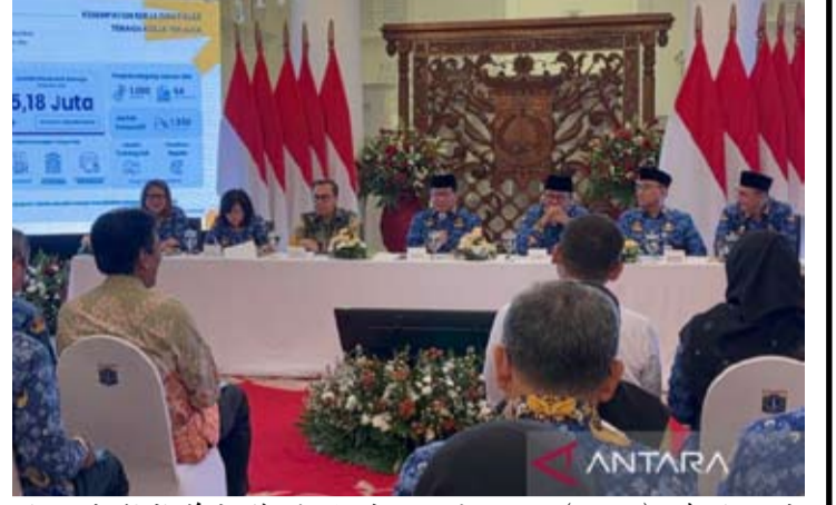
雅加达省长普拉莫诺·阿农于4月17日(周五)在雅加达市政厅举行的雅加达预算对话新闻发布会上发表讲话。

然而,普拉莫诺强调,雅加达省政府致力于维持社会保障体系,以减少经济不平等。实现这一目标的方法之一是继续推行雅加达智能卡(KJP)