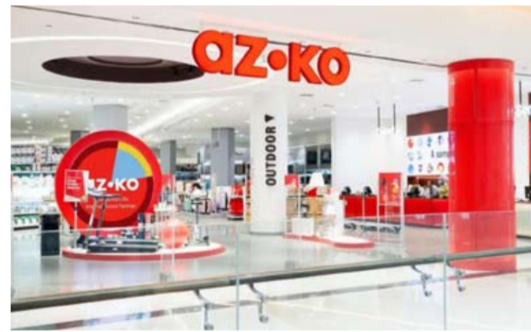
AZKO Living World Alam Sutera 店。

另据ACES报告, 2025年销售额有所增长。尽管销售额增长, 但ACES的净利润实际上有所下降。根据其财务报告, 2025