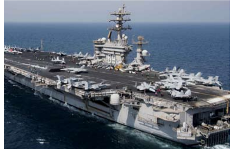
资料图：美国海军“艾森豪威尔”号航空母舰

在“艾森豪威尔”号此次失火之前，美国另一艘航母“福特”号在3月12日发生火灾，舰上的洗衣房起火。火势在数小时后得到控制，但仍造成约200名官兵因吸入浓烟受伤接受治疗。