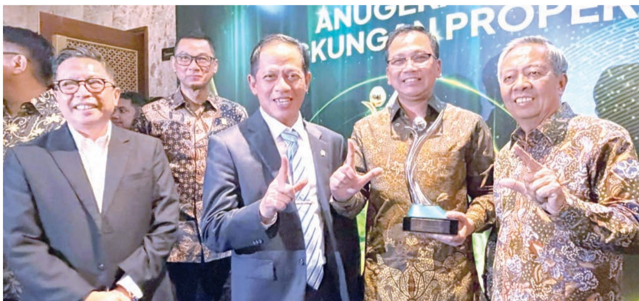
印尼环境部长Hanif Faisol Nurofiq (右三) 在雅加达向Jababeka基础设施公司总裁董事Didik Purbadi (右二) 颁发PROPER绿色评级奖杯。

Didik表示, 随着第六次获得PROPER绿色评级, 公司将进一步巩固其在印尼可持续工业园区转型中的引领地位, 同时为构建更加负责任与包容性的国家工业未来拓展更广阔的合作空间。(mm)