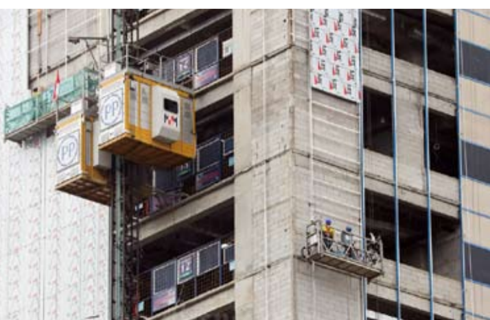
工人在雅加达完成一座高层建筑的建设。

【本报讯】PTPP公司将在雅加达中部的Senen地区加速建设324套宜居住房, 以支持政府在城市住宅区整治方面的计划。