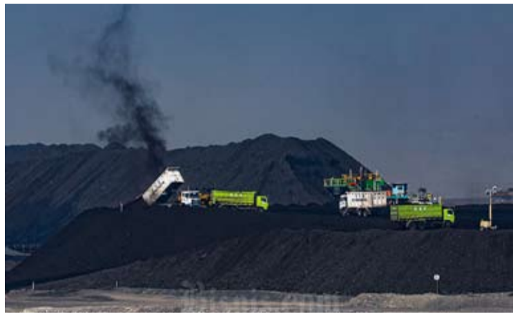
在南苏门答腊省Muara Enim县Tanjung Enim的Bukit Asam公司的煤矿。

【本报讯】国内水泥行业正面临煤炭供应受限的问题, 这已开始干扰工厂的运营。若这种情况持续下去, 停产风险将进一步扩大。