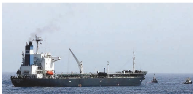
图为一艘我国的油轮。

该规定载于能源与矿产资源部2026年3月第149.K/MG.03/MEM.M/2026号部长决定书关于2026年3月印尼原油价格。