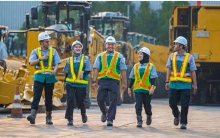
ABM Investama 公司(ABMM)。