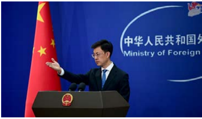
中国外交部发言人郭嘉昆

种迹象表明，日本右翼势力正加快推动安保政策朝着进攻性扩张性方向转变，其所作所为严重违背《开罗宣言》《波茨坦公告》《日本投降书》等具有国际法效力文件的规定，严重违背日本宪法和国内既有规范，对战后国际秩序和地区和平稳定造成严重威胁。