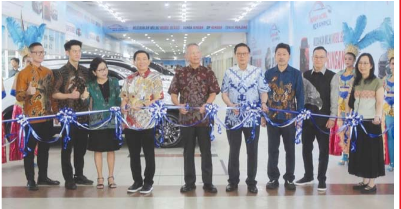
图示。在Maspion Square举行的BCA Finance汽车交易中心的启用仪式。

【本报讯】中亚银行金融公司(PT BCA Finance)在泗水Maspion Square购物中心正式开设了BCA Finance二手车交易中心。该中心的落成标志着该公司在加强印尼二手车融资生态系统方面迈出了战略性一步。 这家二手车交易中心旨在让人们更容易获得优质二手车, 并获得可靠的融资支持。其理念优先考虑消费者的便利性、透明度和交易便捷性。 BCA Finance二手车交易中心占地3176平方米, 可容纳多达207辆汽车, 并与泗水的18家合作展厅携手, 提供丰富的品牌和车型选择。 中亚银行金融公司总经理彼得鲁斯·卡里姆(Petrus Karim)表示, 这家汽车交易中心的开业