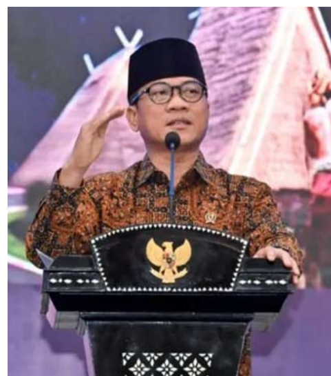
乡村与贫困地区建设部长Yandri Susanto在马塔兰举行的西努沙登加拉省发展计划协商会议上阐述落实乡村经济均衡发展发展的战略。

【本报讯】乡村及贫困地区发展部长扬德里·苏桑托(Yandri Susanto)表示,提议暂停发放现代零售许可证是政府为促进乡村经济均衡发展、避免经济资源过度集中于大型资本持有者的举措。