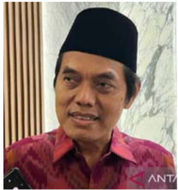
国会第二委员会副主席祖尔菲卡尔·阿尔塞·萨迪金(Zulfikar Arse Sadikin)。

【本报讯】国会第二委员会副主席祖尔菲卡尔·阿尔塞·萨迪金(Zulfikar Arse Sadikin)希望,能在2026年审议关于修订2017年第7号选举法的法律草案。祖尔菲卡尔回顾以往经验表示,选举法原本计划在2019年进行修订。然而,当时的一位法律起草者不愿讨论该法案。