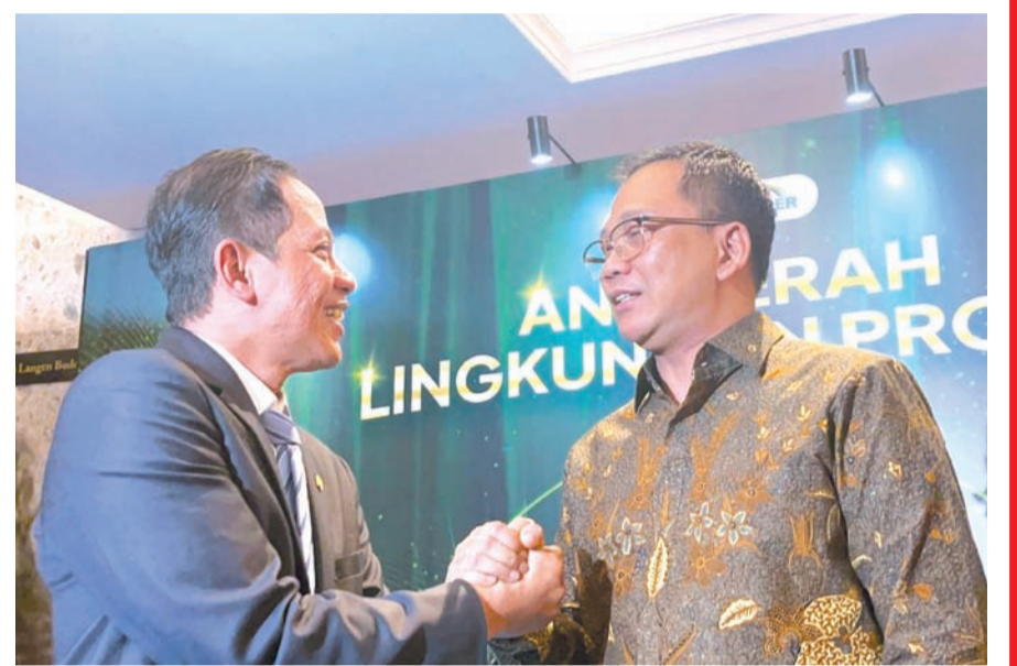
印尼环境部长Hanif Faisol Nurofiq (左) 在雅加达与Jababeka基础设施公司总裁董事Didik Purbadi握手, 庆祝其荣获PROPER绿色评级。