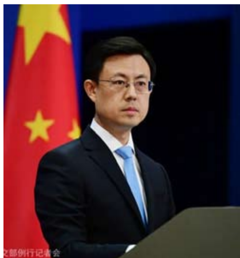
中国外交部发言人郭嘉昆