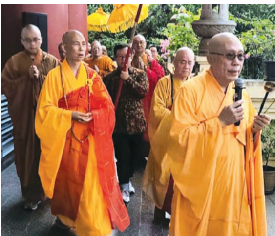
来自海内外高僧大德参与佛舍利绕境祈福仪式。