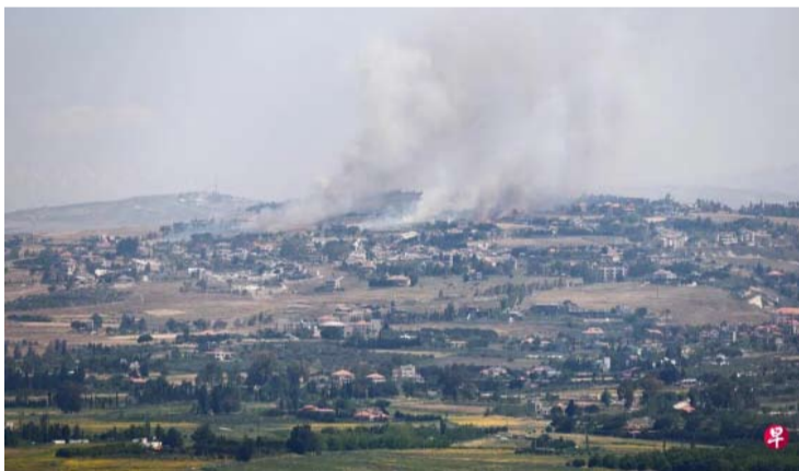
以色列总理内塔尼亚胡周一说，鉴于黎巴嫩真主党屡次违反停火协议，已下令以军对贝鲁特南郊达希耶发动空袭。图为从以色列边境一侧可见黎巴嫩上空升起白色烟雾。

黎巴嫩真主党方面暂未予以回应。报道还援引黎巴嫩政府的消息称，以色列近期对黎巴嫩的袭击，已造成超过3370人死亡。