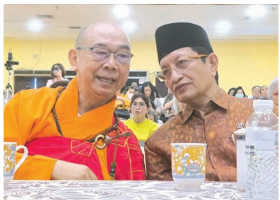
慧雄大和尚与纳萨鲁丁部长亲切交谈。