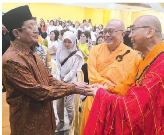
慧雄大和尚欢迎纳萨鲁丁部长到来。