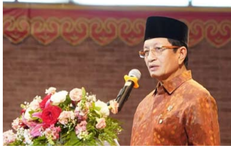
宗教部长纳萨鲁丁·奥马尔发表讲话。

世界和平的精神实际上源于每个人的内心。因此,仁爱的价值观成为在家庭、社会、民族乃至世界范围内构建和谐生活的重要基础。这位Istiqlal大清真寺的大伊玛目强调,政府承诺确保每一位公民都能安全、安心且虔诚地依照自己的信仰进行宗教活动。