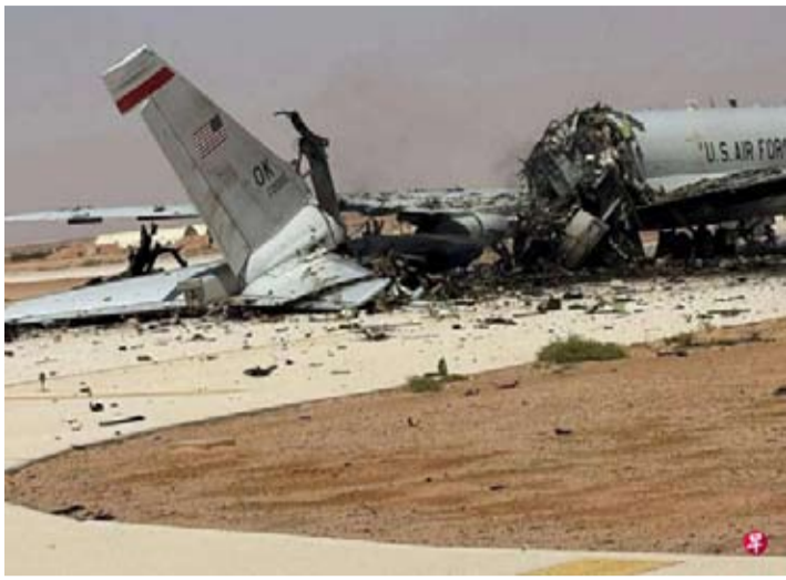
这张取自社媒的照片显示，3月27日，伊朗袭击沙特阿拉伯苏丹王子空军基地，击中一架美军E-3“哨兵”预警机。

科威特方面表示，其防空系统于6月1日清晨开火，拦截来袭的无人机和导弹。伊朗伊斯兰革命卫队在伊朗国家通讯社发布的声明中称，美军袭击了一座通信塔，并表示已作出回应，但没有说明攻击地点。报道称，这可能指的是对科威特的袭击。科威特境内驻有美国陆