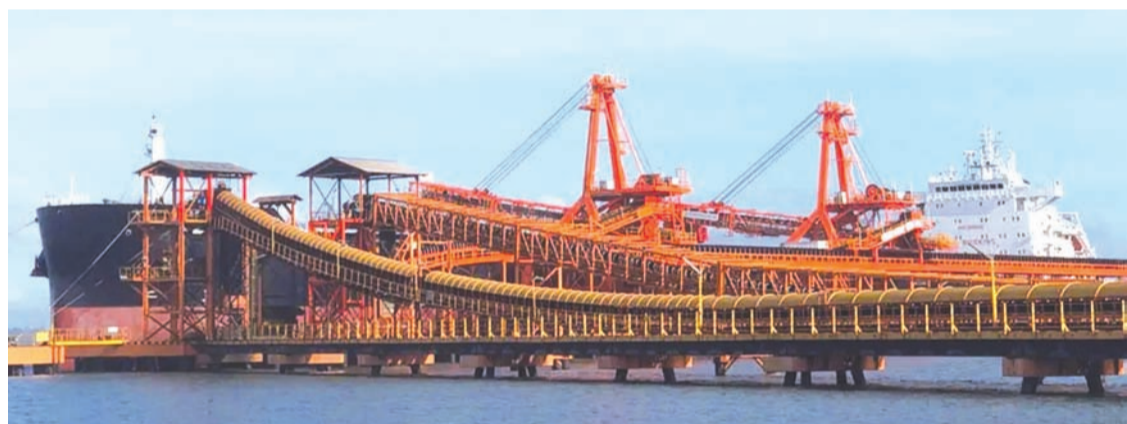
圖為南加里曼丹巴彥集團採礦活動的情況。

【本報訊】印尼礦業專家協會(Perhapi)對Danantara印尼資源有限公司(DSI)是否已準備好統籌管理來自印尼各地800多個礦權地的煤炭出口提出了質疑。