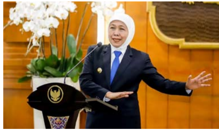
东爪哇省省长科菲法·因达尔·帕拉万萨发表讲话。

资源资本指数作为衡量人力资源发展成功的主要指标以及预测未来世代质量的重要性。她指出,“人力资源资本指数(IMM)的提升取决于孕产妇死亡率、婴儿死亡率和发育迟缓患病率的下降,这些指标反映了卫生服务质量、育儿水平以及人类发展的有效性。”(fd)