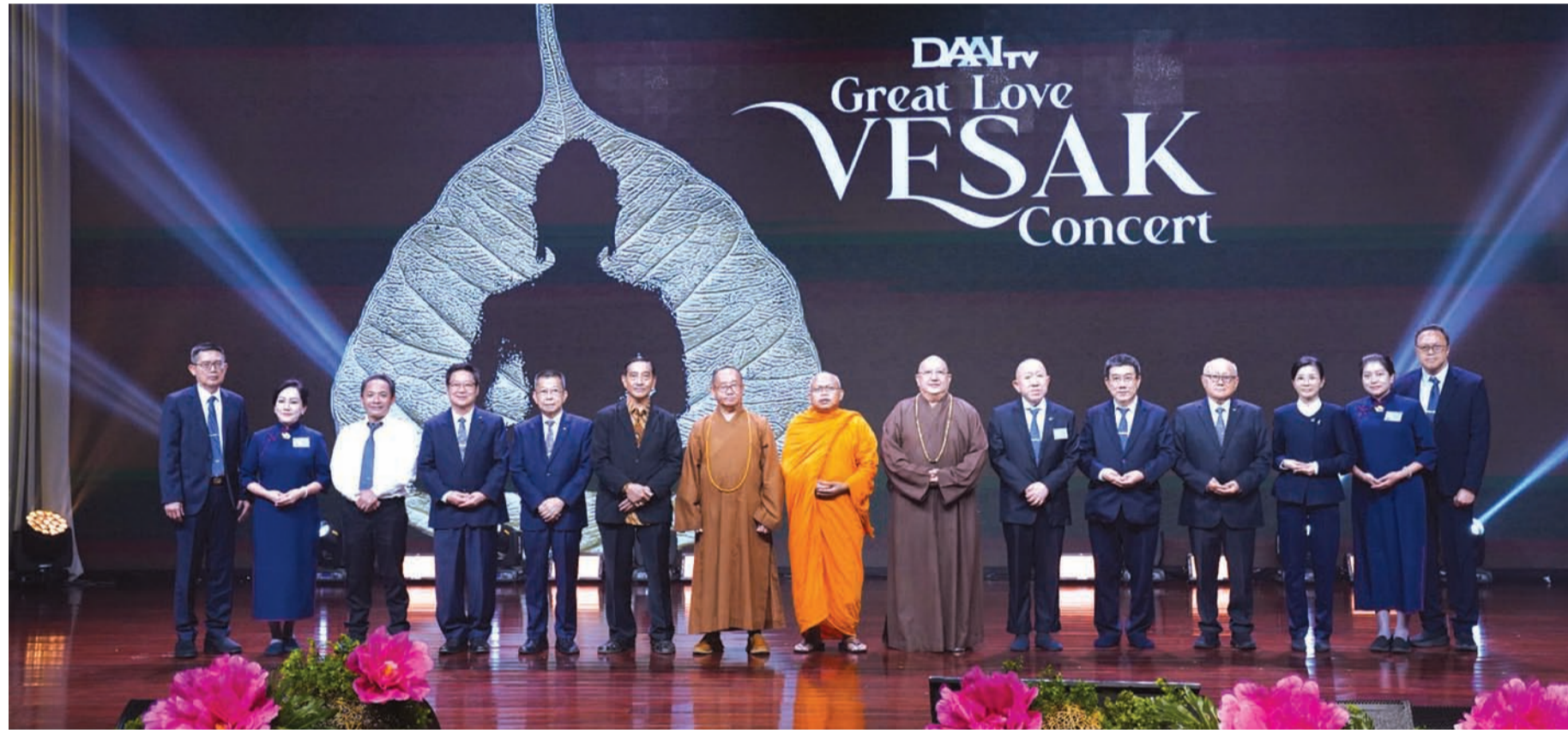
印尼大爱台董事们与宗教领袖合影。

在这个资讯纷杂、生活步调日益快速的时代，印尼大爱电视台深信，人们依然需要平静、慈悲与智慧。透过2026年卫塞音乐会，大爱电视期盼社会大众能重新找回内心的一分宁静，因为唯有从平和的心出发，才能生起为他人付出的善念与行动，为社会带来更多温暖与美善。