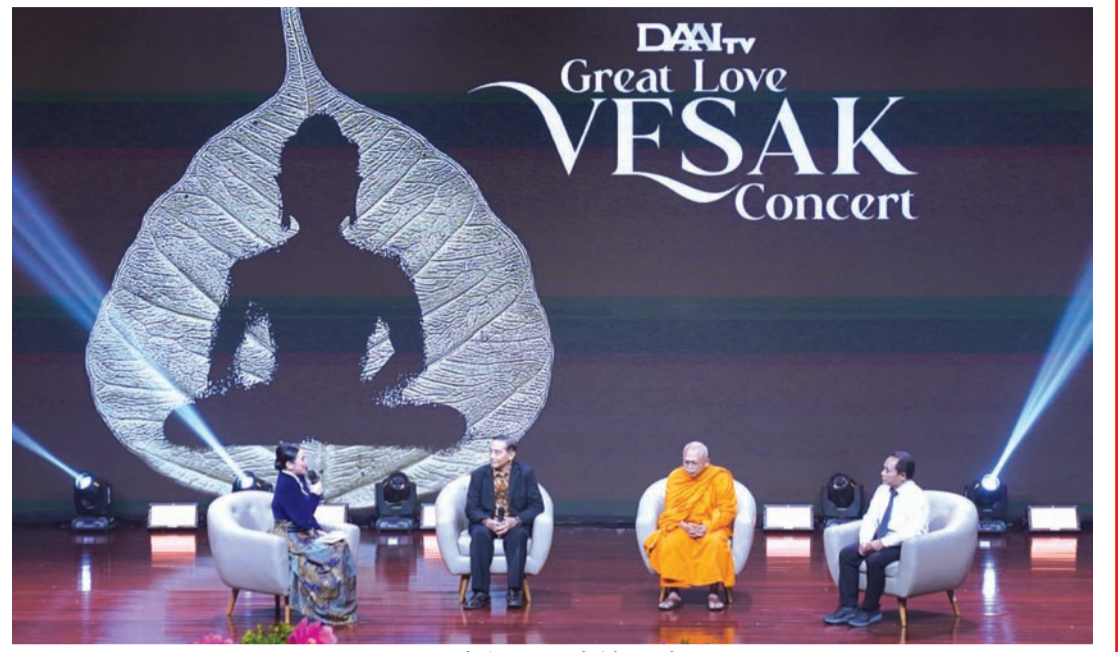
印尼佛教发展座谈环节。

迪提三般若大长老在分享中表示，爪哇地区许多佛寺除了作为修行与礼佛场所，同时也承载着保