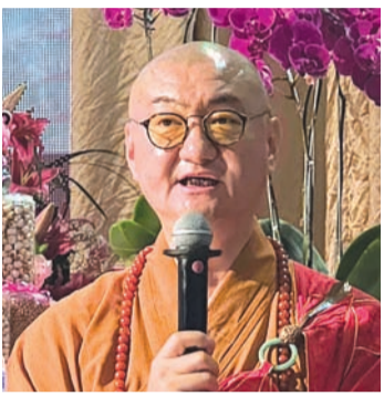
上海龙华寺首座中观大和尚作分享。