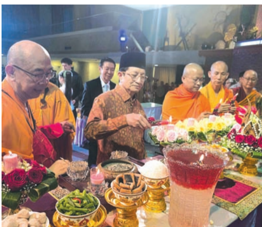
慧雄大和尚与纳萨鲁丁部长等燃灯卫塞祈福平安灯。