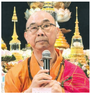
慧雄大和尚佛法开示。