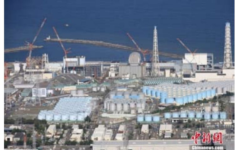
资料图为当地时间2023年8月24日，航拍福岛第一核电站。

2023年8月，日方无视国际社会的强烈质疑和反对，单方面强行启动福岛第一核电站核污染水排海。截至目前共完成19次核污染水排放，累计排放量近15万吨。