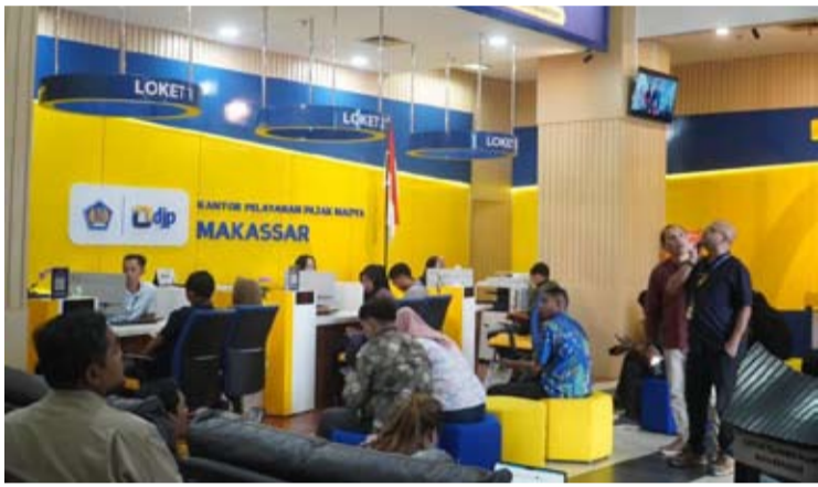
图为：望加锡一处税务服务办公室的办税现场。

油气行业方面，则包括17份盾币申报表和270份美元申报表。此外，自2025年8月1日