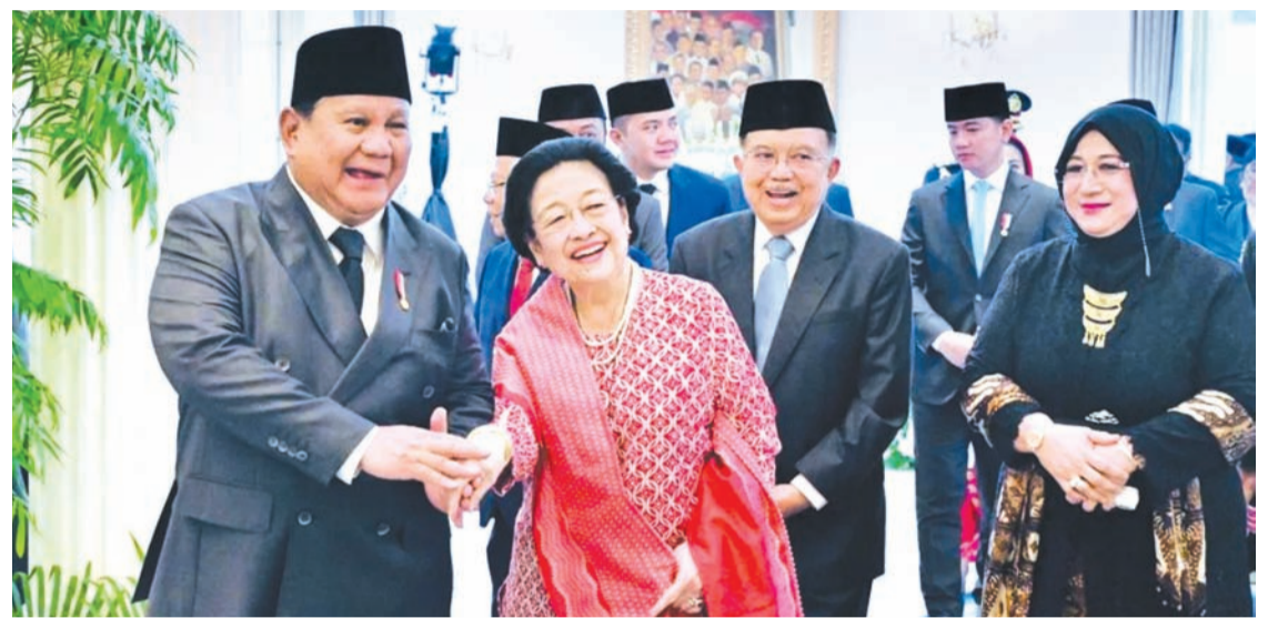
周一(6月1日)，普拉博沃·蘇比安托總統(左)與我國第五任總統梅加瓦蒂·蘇加諾普特麗在雅加達舉行的班查西拉誕生紀念儀式後交談的情景。

哈斯托當日在雅加達南區連登阿貢的At-Taufiq清真寺庭院出席班查西拉誕生紀念日活動後，表達了這一期望。