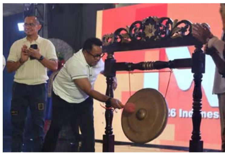
雅加达副省长拉诺·卡尔诺于5月30日在雅加达敲锣象征印尼世界舞蹈节(IWDF)正式开幕。

和体育领域。”他说道。2026年印尼世界舞蹈节(IWDF)将在雅加达中区的Sawah Besar的Pos Bloc举行。该活动既是世界舞蹈日纪念活动的一部分,也是迎接雅加达建市500周年系列活动的环节之一,并致力于强化雅加达作为以文化为基础的全球城市的地位。