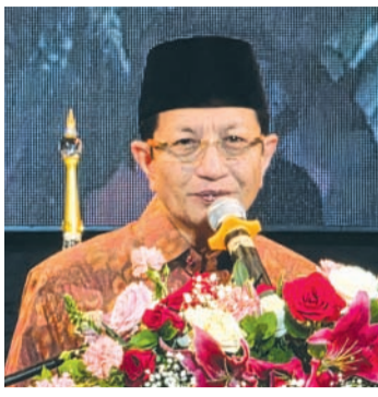
纳萨鲁丁部长致辞。