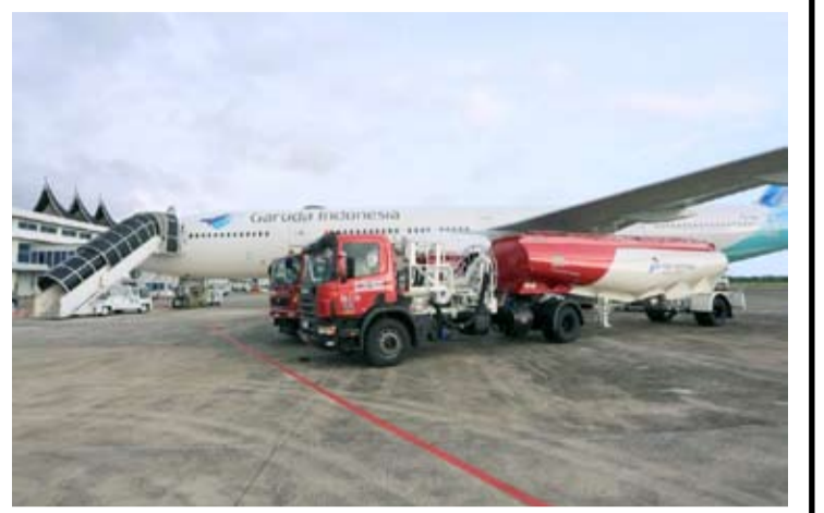
Pertamina Patra Niaga油罐车为鹰航飞机加注航空燃油。

【本报讯】自2026年6月1日起, Pertamina Patra Niaga公司将航空燃油价格下调至多10%, 以支持国家的航空运输互联互通。